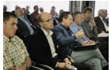
Interessierte Zuhörer an der Fachtagung

fünf Jahre Zeit, das Funktionieren und die Auswirkungen der Liberalisierung bei den Grossverbrauchern zu beobachten und zu entscheiden, ob die Liberalisierung weitergeführt und auch auf die Kleinverbraucher ausgedehnt werden soll.